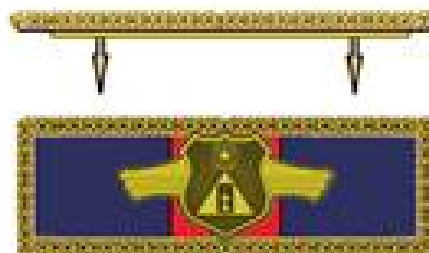
BARRETA (VISTA LATERAL E FRONTAL)