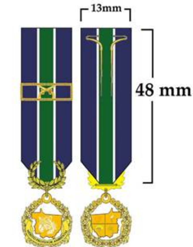
MINIATURA 18mm de diâmetro